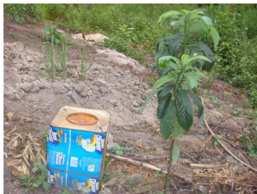
วิธีการให้ปุ๋ยหมัก