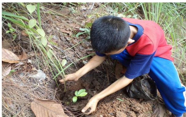
เด็ก ๆ ปลูกต้นไม้ด้วยความตั้งใจ