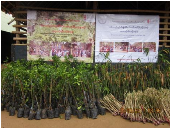
เตรียมกล้าไม้ที่จะปลูกในวันสิ่งแวดล้อมโลก

ภาพงานวันสิ่งแวดล้อมโลก ณ หมู่บ้านแม่ดี ตำบลแม่สามแลบ อำเภอสบเมย จังหวัดแม่ฮ่องสอน