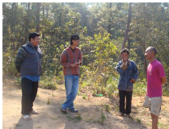
เจ้าหน้าที่มูลนิธิฯ หารือตามผลการดำเนินงาน