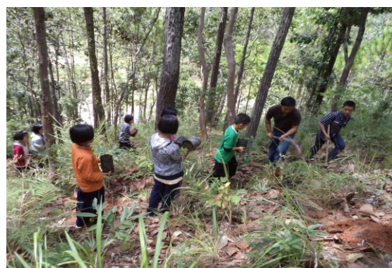
เยาวชนรักสิ่งแวดล้อมร่วมกันปลูกป่าในพื้นที่ต้นน้ำ เสา่ ทว่า ทล่ำ สี