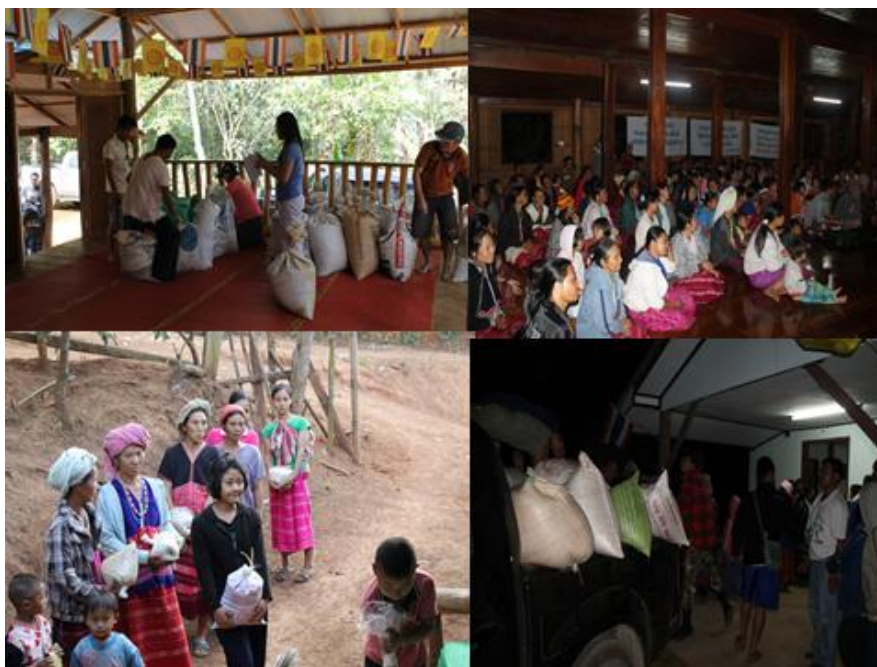
ลงพื้นที่รับบริจาคข้าวเปลือก ตามชุมชนต่าง ๆ อำเภอปางมะผ้า จังหวัดแม่ฮ่องสอน