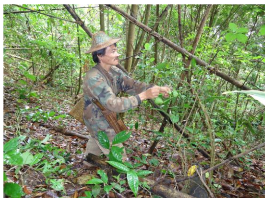
เด็ดใบชาเพื่อนำไปตากแห้ง