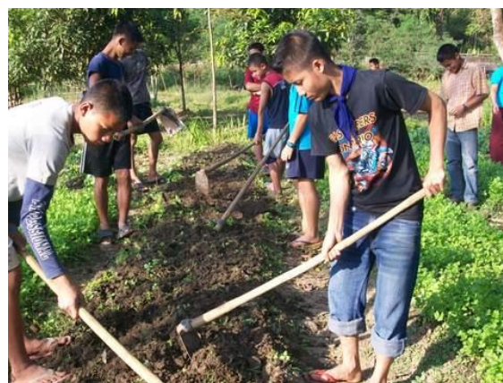
ส่งเสริมด้านการปลูกผัก ช่วยเหลือตนเองในด้านอาหาร