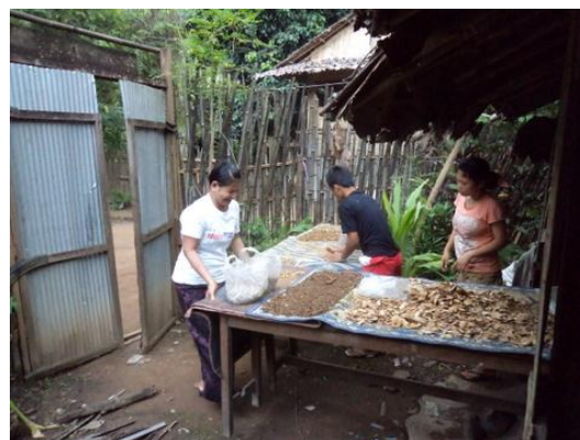
แยกชนิดสมุนไพรและตากแห้ง