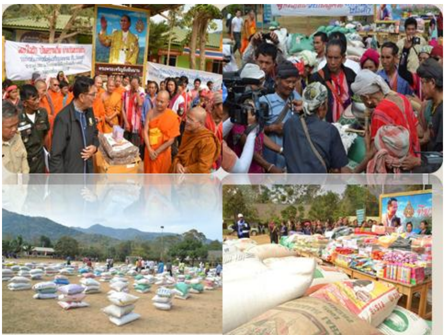
บรรยากาศการส่งมอบข้าวเปลือกผ่านผู้ว่าราชการจังหวัดเพชรบุรี