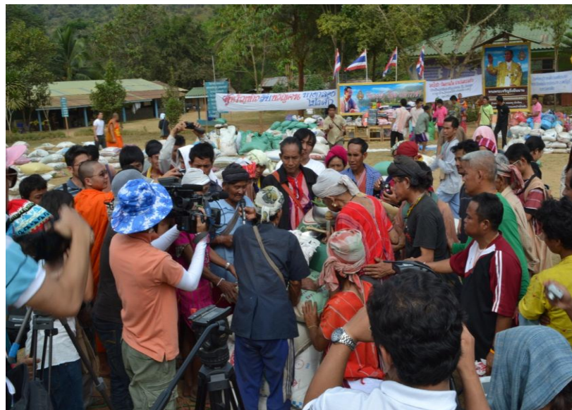
พิธีรับขวัญข้าว สู่ขวัญคน โดยปู่คออี้