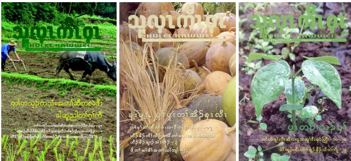
ตัวอย่างวารสารปกากะญอ