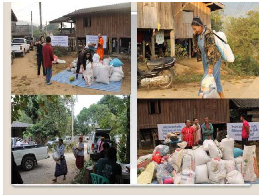
ลงพื้นที่รับบริจาคข้าวเปลือก ตามชุมชนต่าง ๆ อำเภอแม่แตง จังหวัดเชียงใหม่