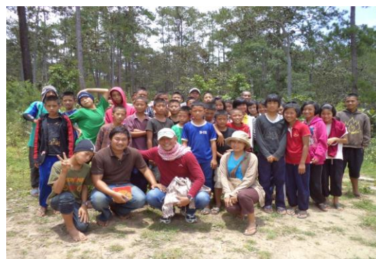
เจ้าหน้าที่และอาสาสมัครร่วมกันปลูกป่าในวันสิ่งแวดล้อมโลก