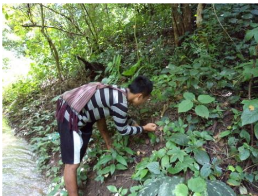
ผู้เช่าอบรมกำลังทรวัดตุติบที่จะนำมาแปรรูปสมุนไพร