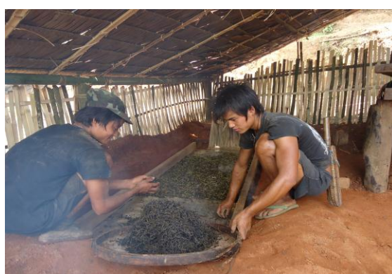
นำไปคั่วให้แห้ง