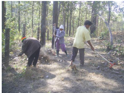
กลุ่มสมาชิกร่วมกันทำแนวกันไฟในเดือนกุมภาพันธ์