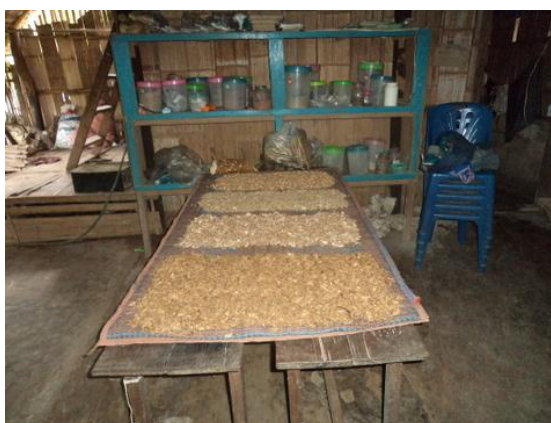
แปรรูปสมุนไพรเป็นยาชนิดต่าง ๆ