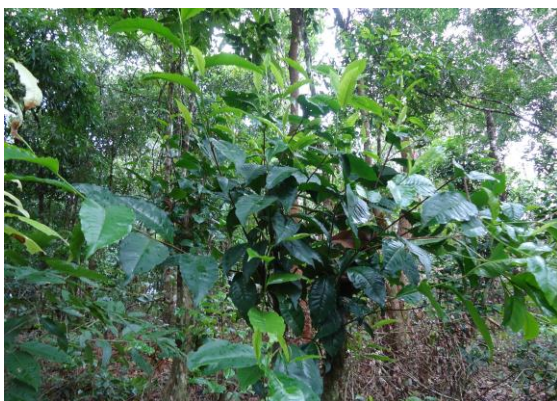
ต้นชาในชุมชนปกากะญอ