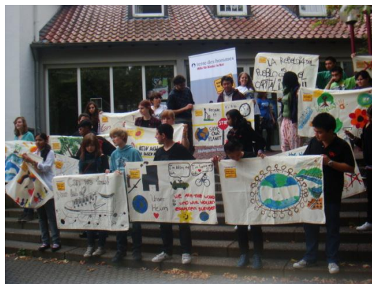
ตัวแทนมูลนิธิฯ แลกเปลี่ยนสถานการณ์สิ่งแวดล้อม