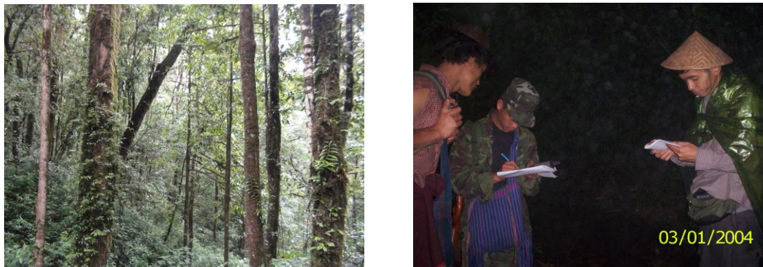
ทีมงานวิจัยลงพื้นที่สำรวจ