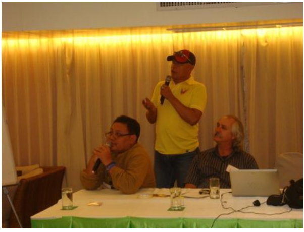
วิทยากรกำลังให้ความรู้เกี่ยวกับวิธีการรับมือกับสภาพภูมิอากาศที่เปลี่ยนแปลง