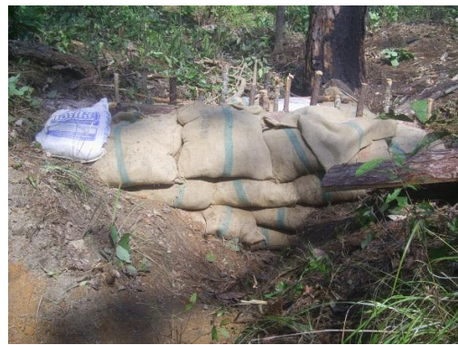
ฝายขนาดใหญ่