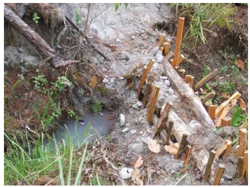
เจ้าหน้าที่จากหน่วยจัดการต้นน้ำฯ ร่วมกันสร้างฝายกับกลุ่มสมาชิก