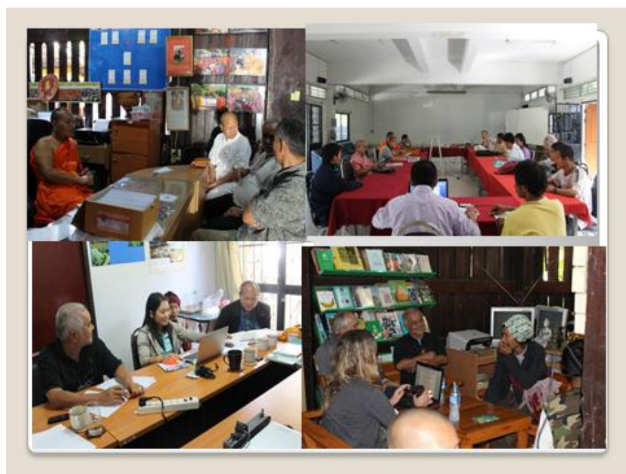
คณะทำงานประชุมวางแผน/เตรียมงาน