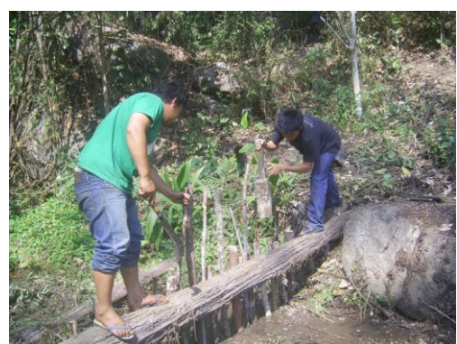
เจ้าหน้าที่โครงการกำลังซ่อมแซมฝาย