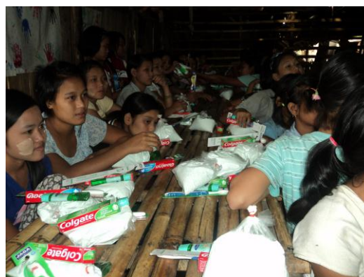
ให้ของใจที่จำเป็นในชีวิตประจำวัน