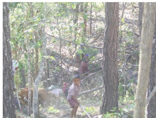
กลุ่มสมาชิกร่วมกันทำแนวกันไฟในเดือนกุมภาพันธ์