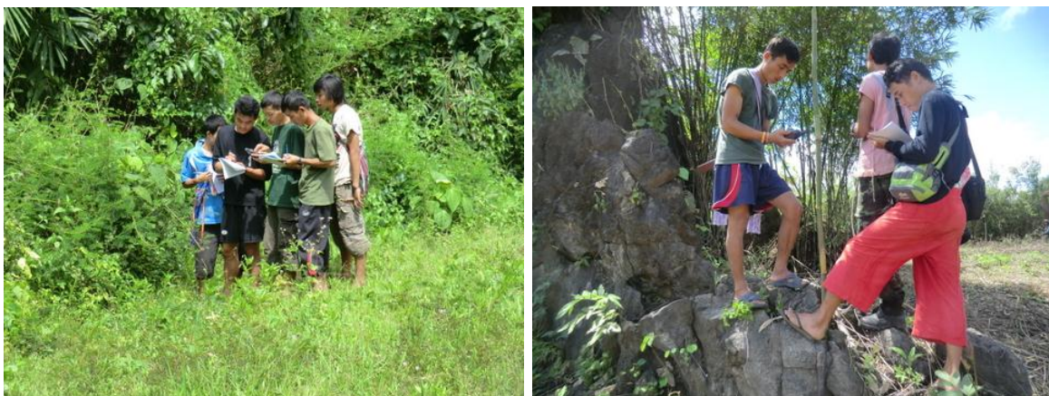
ภาพวิทยากรกำลังกำลังสอนผู้เข้าอบรมในการหาจุดพิกัด และสอนในการเก็บรวบรวมข้อมูล