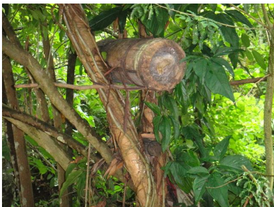
การเลี้ยงผึ้งตามชุมชน