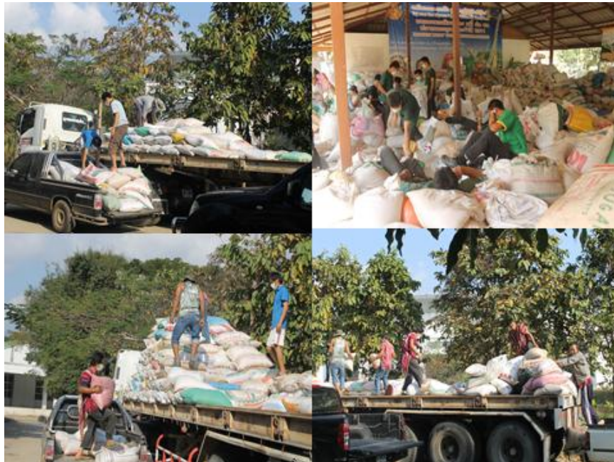
บรรยากาศการขนข้าวเปลือกขึ้นรถแทรกเตอร์เพื่อเอาไปแก่งกระจาน