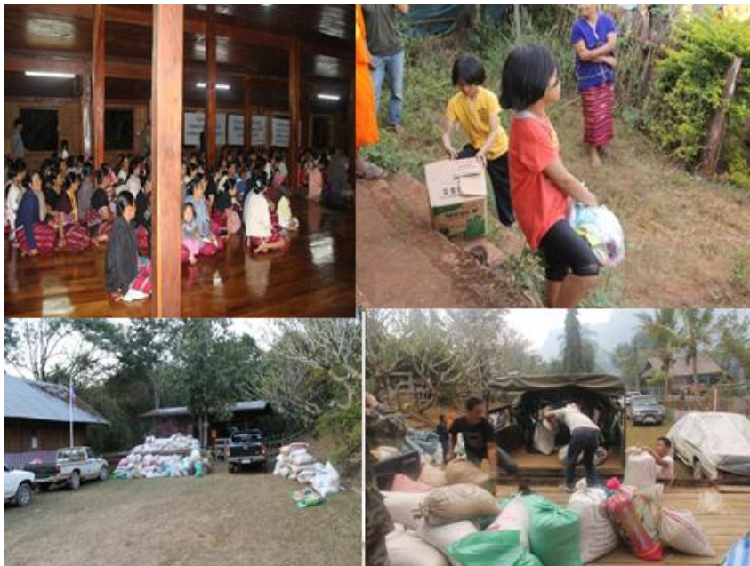
ลงพื้นที่รับบริจาคข้าวเปลือก ตามชุมชนต่าง ๆ อำเภอปาย จังหวัดแม่ฮ่องสอน