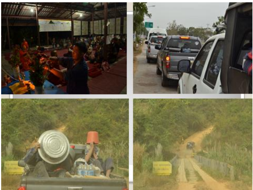
ช่วงระยะเวลาที่เดินทางจากจังหวัดเชียงใหม่ สู่ ตำบลห้วยแม่เพรียง อำเภอแก่งกระจาน จังหวัดเพชรบุรี