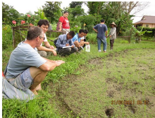
เจ้าของฟาร์ม กำลังให้ความรู้เกี่ยวกับการปลูกข้าว