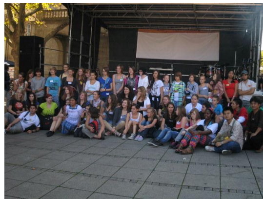
ถ่ายรูปพร้อมกันหลังจากที่เสร็จสิ้นการประชุม