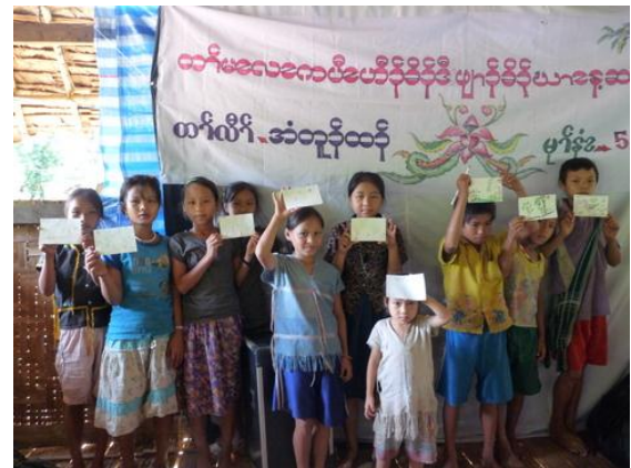
เด็ก ๆ ร่วมทำกิจกรรมวาดรูปเกี่ยวกับธรรมชาติและสิ่งแวดล้อม