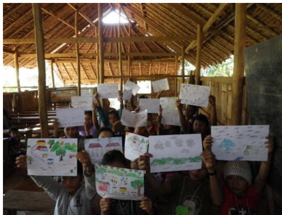
เด็กที่มาเข้าค่ายร่วมทำกิจกรรมกับอาสาสมัครและเจ้าหน้าที่มูลนิธิ