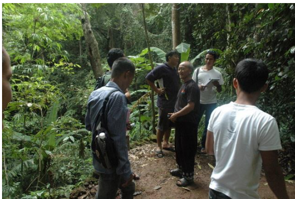
ให้ความรู้เกี่ยวกับการทำเกษตรแบบผสมผสาน